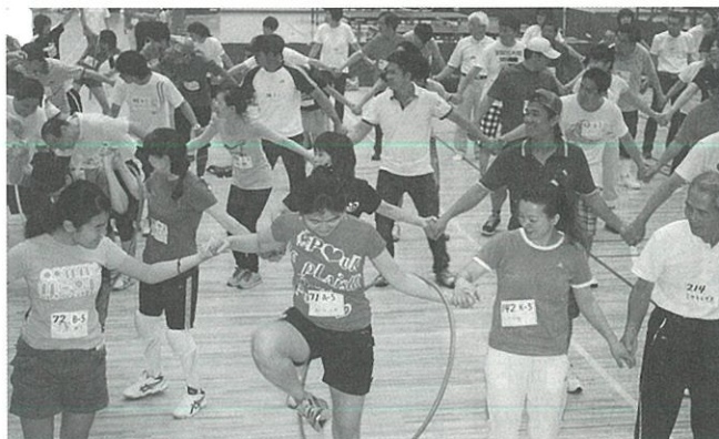
第7回 TIRA 国際スポーツ交流会