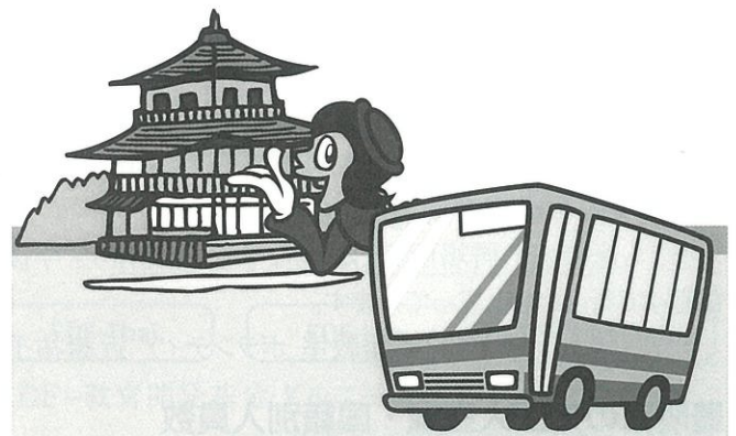
日帰りバスツアー