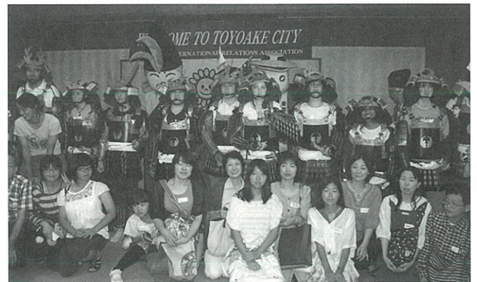
ウェルカムパーティー シェパトン高校&ワンガヌイパーク セカンダリーカレッジ