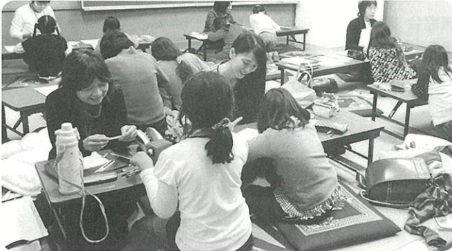
子ども日本語教室、授業風景

毎週（木）15時30分～16時30分 場所：二村会館（双峰小学校内） 共催：生涯学習課