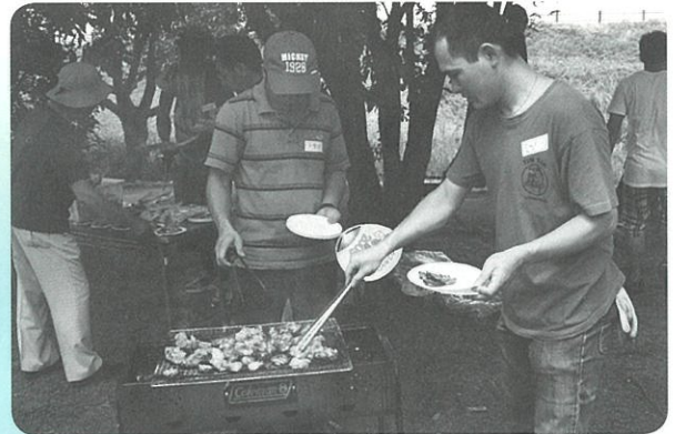
バーベキューパーティー