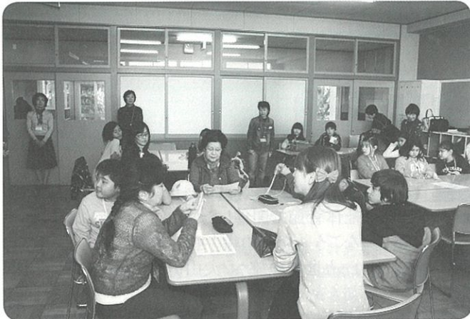
子ども日本語教室・授業風景

毎週（木）15時30分～16時30分 場所：二村会館（双峰小学校内） 共催：豊明市生涯学習課 教育委員会・生涯学習課