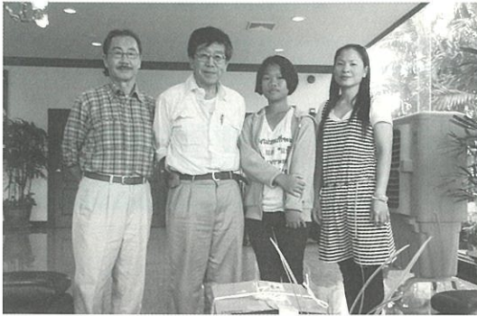
先生とチンケリーさん

出発の直前に、先方の民際交流センターの担当者から「所用でバンコクに出て行くから、そこで会おう」と連絡が入り会うことになりました。