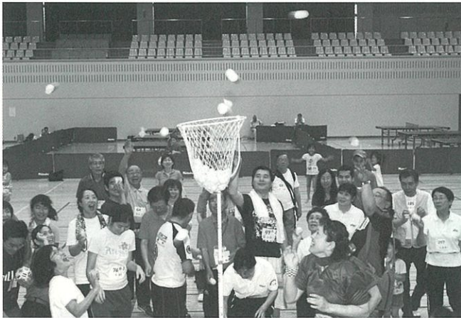
第6回 TIRA 国際スポーツ交流会

このような事業には、誰でも参加できます。豊明市、また近郊に住んでいる外国籍の方々と色々な機会を通じ交流しましょう。活動紹介は、豊明市国際交流協会のホームページでも案内しています。