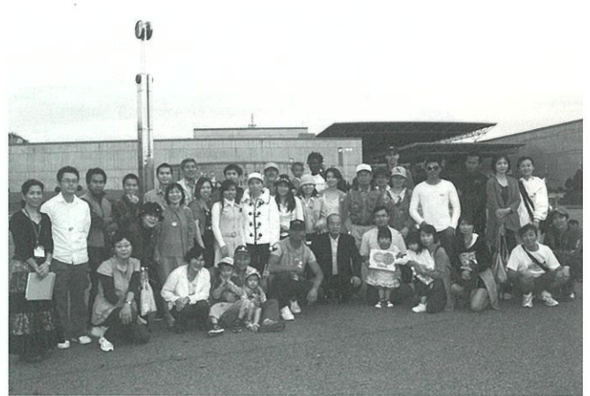
日帰りバスツアー、リトルワールド