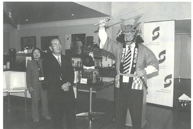
友好都市シェパトン市の副市長と交流会