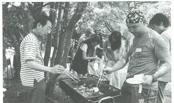
毎年初夏に催される学習者とボランティアとの交流バーベキュー