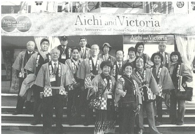
記念式典ブース前の参加メンバー

友好都市提携を行っているシェパトン市への第3回目の市民による親善訪問を行いました。桶狭間の戦いから450年でもありますので会員が作成した甲冑を贈呈し、日本文化の紹介を行うなど大いに市民交流による相互の親善を深めることが出来ました。また今回は、愛知県とビクトリア州の友好提携30周年の記念式典及び記念行事がメルボルン市で開催されたことから、併せてTIRAとしてその行事に参加し記念行事を盛り上げました。