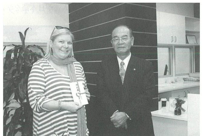
干ばつによる被害に100円募金で義援金