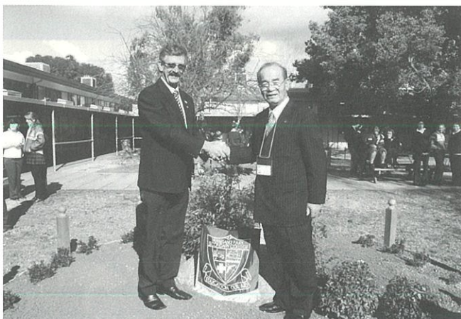
WPSA 校の日本庭園の造園式典