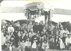
ドンキ&サンチョのグリーティングカレセル像