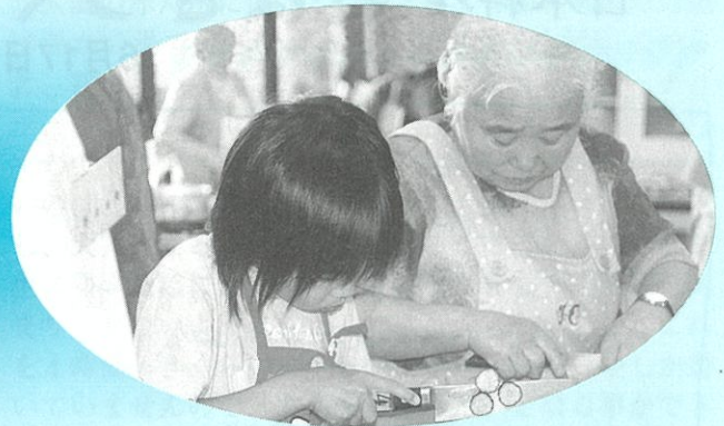
世界の料理教室 「日本料理」 6月17日