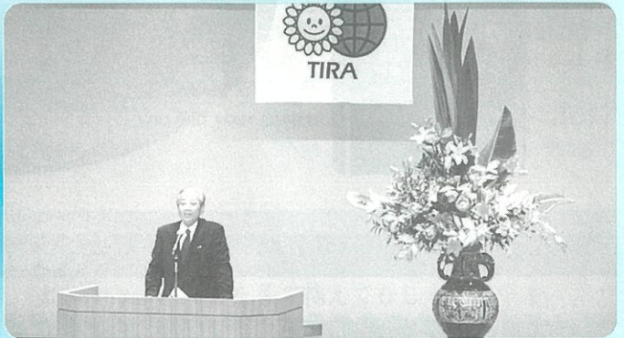
総会・みにこんさ〜と 6月10日