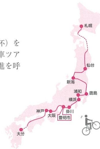
2002韓・日ワールドカップ開催都市自転車ツアー