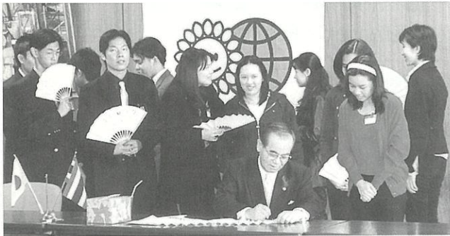
(市長のサインがタイの青年達に大好評)

日本への理解と交流を深める為「タイ日親善クラブ国際交流使節団」の青年が豊明市を訪れました。