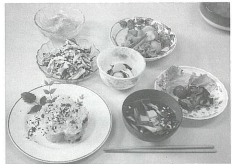
(赤飯・肉じゃが・魚のみそ焼・酢の物・わらび餅他)

6月25日に豊明市国際交流協会が開催した日本料理教室に参加して、先生達はみんな優しく親切でした。モランテアのみて、本当によかったと思いました。一番印象が良かった料理は肉じゃが、以前日本料理の本を買って、作ったけど、あまりおいしくなかった。だから先生が居て、本番の日本味が目の前に詳しく教えてもらって、本当によかった。自分が作るとはぜんぜん違って、すごくおいしくできました。そして会費五〇〇円も手頃で料理の栄養バランスもよく、和食のおかずの基本並ぶ方も教えてもらって、とても楽しく充実でした。もっと機会があるといいですね。ぜひまた参加したいです。そして先生達には大変お世話になりました。そしてありがとうございました。今度また友達を誘って行きますのでどうぞよろしくお願ひします。