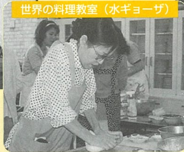
世界の料理教室(水ギョーザ)