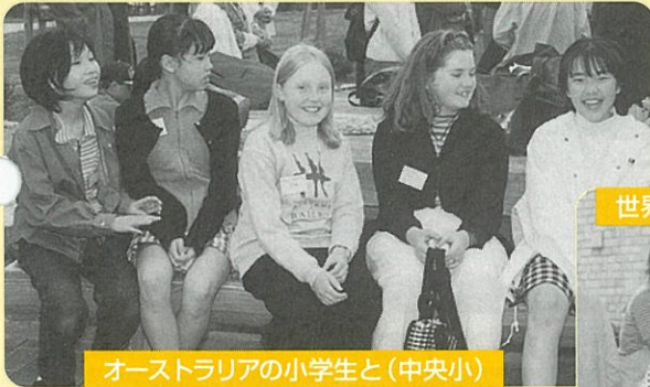
オーストラリアの小学生と(中央小)